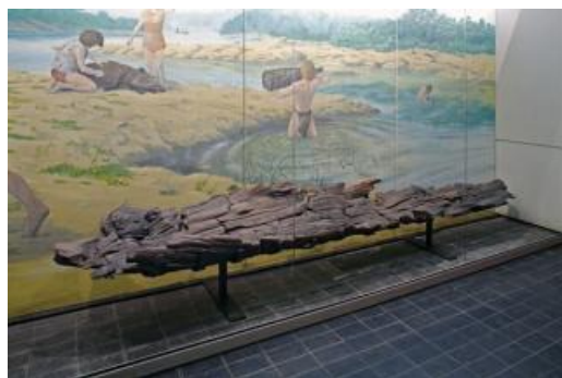
La pirogue mésolithique installée au musée.

Cet atelier aura pour but de lester par équipe une mini pirogue en répartissant les charges de telle manière qu'elle flotte sans couler. Il permettra aussi de découvrir les pirogues anciennes conservées au musée. Ce jeu qui se déroulera à l'extérieur et à l'intérieur du musée et est conçu aussi bien pour les familles que pour les groupes d'amis. Plusieurs équipes pourront s'affronter.