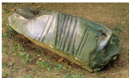
Polissoir de Rumont.

Cet atelier aura pour but d'identifier à quoi servait le polissoir de Rumont (77) présenté dans le patio 6 du musée, en replaçant une série d'objets dans l'ordre de façonnage, du silex à la hache polie emmanchée. Ce jeu qui se déroulera à l'extérieur et à l'intérieur du musée et est conçu aussi bien pour les familles que pour les groupes d'amis. Plusieurs équipes pourront s'affronter.