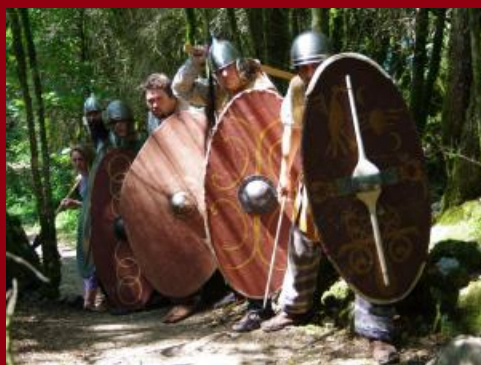
Troupe de reconstitutio Brannic

A l'occasion de la Fête de la Science, le musée accueille les reconstitutions historiques gauloises.