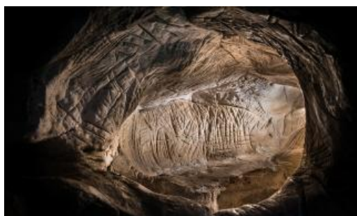
Villeneuve-sur Auvers (Essonne)