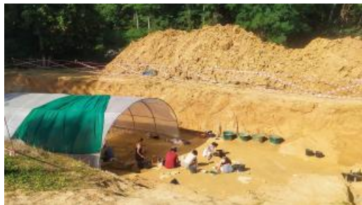
Vue du chantier de fouilles préhistoriques d'Ormesson (77)