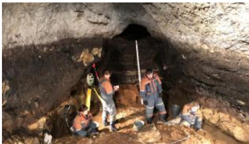
Vue du chantier de fouilles préhistoriques de Denisova (Russie)

Conférence de Jean-Jacques Hublin, paléoanthropologue, directeur du département d'évolution humaine à l'inst