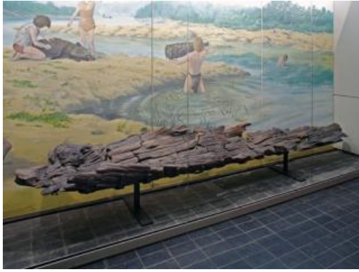
La pirogue mésolithique installée au musée.

Les différentes fouilles du site de Noyen-sur-Seine (de 1970 à 1987 et de 1992 à 1993) ont livré de nombreux vestiges correspondant à 9 millénaires d'occupation humaine.