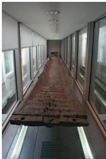
La barque carolingienne installée dans sa vitrine au musée.

En octobre 1992, la reconstruction du barrage-écluse du Vezoult et le creusement d'un canal recoupant une boucle de la Seine ont entraîné la découverte d'une importante embarcation carolingienne, en amont de Noyen-sur-Seine (Seine-et-Marne). À sa découverte, l'une des extrémités a été endommagée par une pelle mécanique.