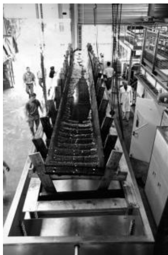
La barque carolingienne en cours de restauration.

Les objets en bois conservés pendant plusieurs siècles ou millénaires dans des dépôts naturels de tourbe constamment humides sont dits « gorgés d'eau ». Il est alors primordial de conserver ces objets en atmosphère humide pour éviter leur dégradation par dessèchement au contact de l'air.