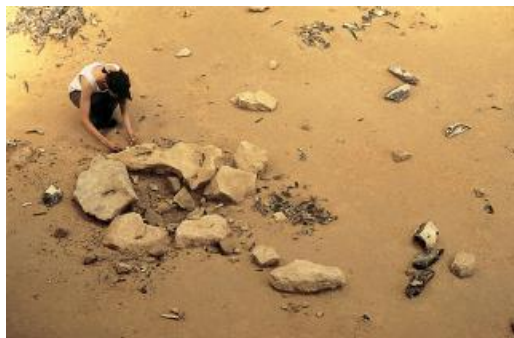
Le foyer d'habitation D71.

Cependant, à côté de ces comportements qui se retrouvent de niveau en niveau et semblent bien ancrés dans des traditions culturelles, on observe aussi une grande diversité des aménagements de l'habitat, signe d'une certaine liberté des choix dans ce domaine.