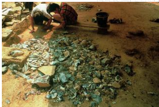
Amas de silex de l'unité d'habitation QR5, composé de près de 15 000 pièces.