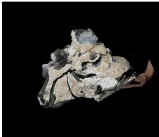
Nucléus partiellement remonté avec ses éclats