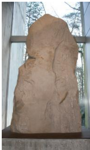
Menhir de Maisse.

Les gravures néolithiques sont assez rares en Île-de-France. On connaît quelques figurations très stylisées sur des sépultures collectives du Néolithique (Période s'étendant, dans notre région, de 5100 – 2300 avant J.-C. Elle correspond au passage du mode de vie nomade des chasseurs cueilleurs préhistoriques à un mode de vie sédentaire fondé sur l'agriculture et l'élevage.) final : monuments du « Mississippi » à Marly-le-Roi (Yvelines), de la « Cave aux Fées » à Brueil-en-Vexin (Yvelines) ou de la « Pierre Turquoise » à Saint-Martin-du-Tertre (Val-d'Oise).