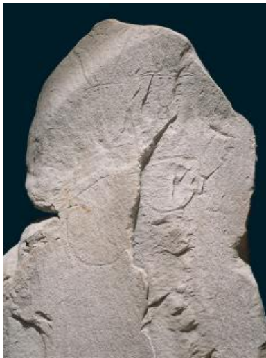
Détail des gravures