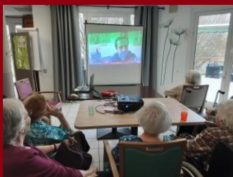
Résidence La Caravelle, St Souplets (77)

L'expérience des visites à distance se poursuit ! Après les scolaires et le grand public, le musée de Préhistoire d'Île-de-France propose désormais des visites guidées en ligne pour les résidents de maison de retraite.