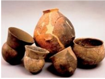
Céramiques du groupe de Noyen.

Dans ce même secteur de la vallée de la Seine, comme dans toutes celles du Bassin parisien, d'autres enceintes sont connues et suggèrent le partage et le contrôle des territoires entre les différentes communautés néolithiques. Mais des habitats ouverts, dépourvus de retranchement, sont également attestés.