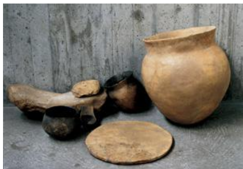
Meule en pierre et récipients en terre cuite.

Contrairement aux habitations de type « Danubienne » du Néolithique ( Période s'étendant, dans notre région, de 5100 – 2300 avant J.-C. Elle correspond au passage du mode de vie nomade des chasseurs cueilleurs préhistoriques à un mode de vie sédentaire fondé sur l'agriculture et l'élevage. ) ancien (caractérisées par de grandes maisons de bois et de torchis, reconnaissable à leurs cinq rangées trous de poteaux), l'habitat de Noyen-sur-Seine n'a laissé que quelques cuvettes, certaines empierrées, pouvant correspondre à des foyers. Ces espaces d'habitat dépourvus de structure posent alors la question de la nature des constructions. Cependant, la bonne préservation du niveau d'occupation, fouillé sur 10 000 m 2 , a permis une analyse de la dispersion des vestiges et une restitution de l'organisation de l'habitat.