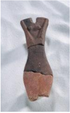
Figurine en terre cuite.