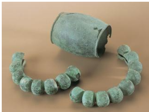
Bracelets en bronze.