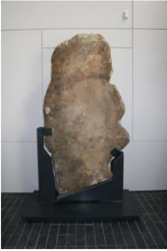
La stèle gravée installée au musée.

Long de 2,10 m et large de 1,20 m, ce monolithe en grès devait être dressé au Néolithique (Période s'étendant, dans notre région, de 5100 – 2300 avant J.-C. Elle correspond au passage du mode de vie nomade des chasseurs cueilleurs préhistoriques à un mode de vie sédentaire fondé sur l'agriculture et l'élevage. ). Trois figurations anthropomorphes ont été réalisées par incision. Elles présentent des similitudes avec celles de la stèle de Maisse, tant au niveau du visage (nez, yeux, coiffe) que du corps du personnage central.