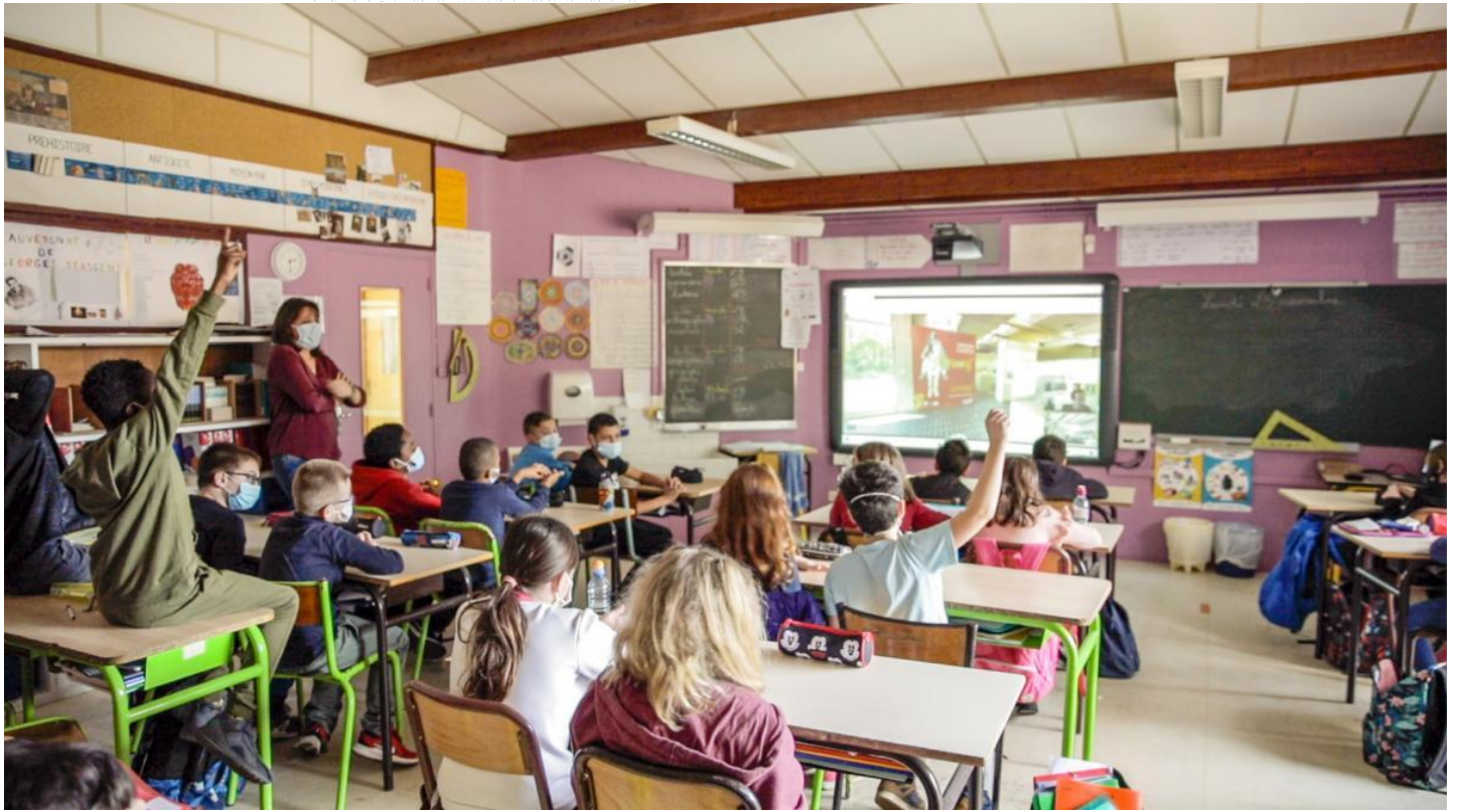
Une classe participant à une visite guidée à distance