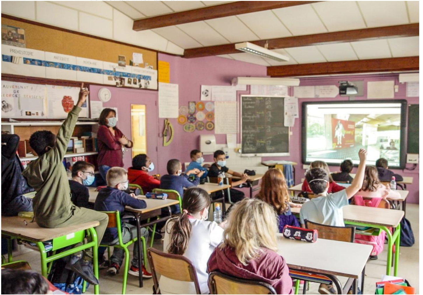
Une classe participant à une visite guidée à distance