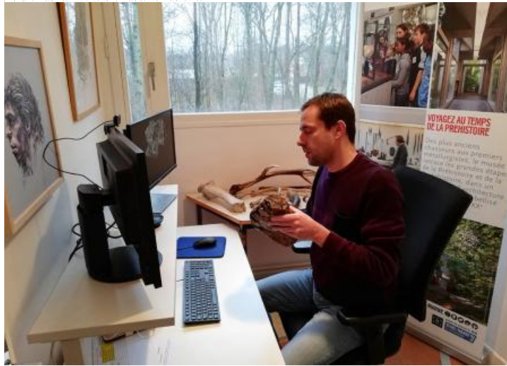
Une visite guidée à distance menée par un médiateur du musée.