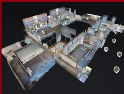
Visite virtuelle du parcours permanent du musée

En visio-conférence depuis chez vous, découvrez le parcours principal du musée de Préhistoire d'Île-de-France. La visite est commentée en direct par un médiateur du musée. Gratuit. Réservation obligatoire.