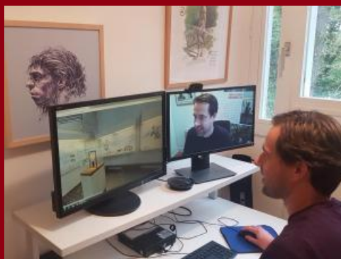
Visite à distance commentée par un médiateur du musée

En visio-conférence depuis chez vous, découvrez le parcours principal du musée de Préhistoire d'Île-de-France. La visite est commentée en direct par un médiateur du musée. Gratuit. Réservation obligatoire.