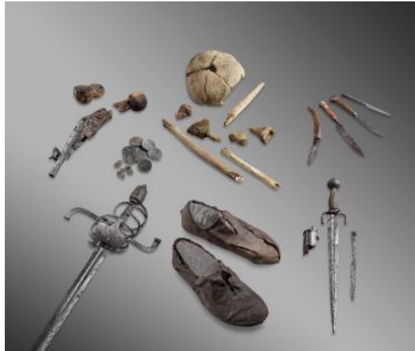
Vestiges du squelette et de l'équipement du voyageur dit le « Mercenaire ». Glacier du Théodule, Zermatt (VS, Suisse) Début du XVIIe siècle (vers 1600).

L'exposition « Mémoire de glace » constitue une occasion unique de contempler une sélection d'environ 150 pièces rarement exposées... comme des équipements d'époques très diverses, de la Préhistoire (Histoire de l'humanité avant l'apparition de l'écriture. Par usage et extension, discipline scientifique qui étudie cette période.) à la période contemporaine : objets perdus et témoins de disparitions accidentelles.