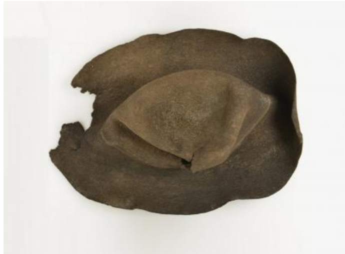
Chapeau en feutre de la « Bergère de Porchabella ». Glacier de Porchabella, Bergün (GR, Suisse) - Fin du XVIIe siècle