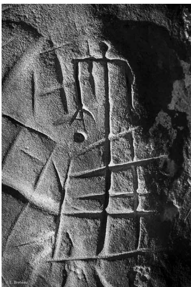
5. Fontainebleau (Seine-et-Marne) « Le Mont Aiveu », abri sous roche Personnage tridactyle et quadrillages.