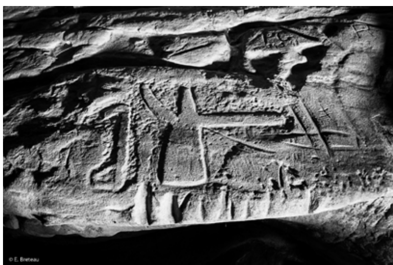
6. Buthiers (Seine-et-Marne) « La Vallée aux Noirs », la Grotte à la Hache Hache polie emmanchée et probable croce obtenues par piquetage. Elles représentent des objets réels datant du Néolithique, et plus précisément du V e ou du début du IV e millénaire avant J.-C.