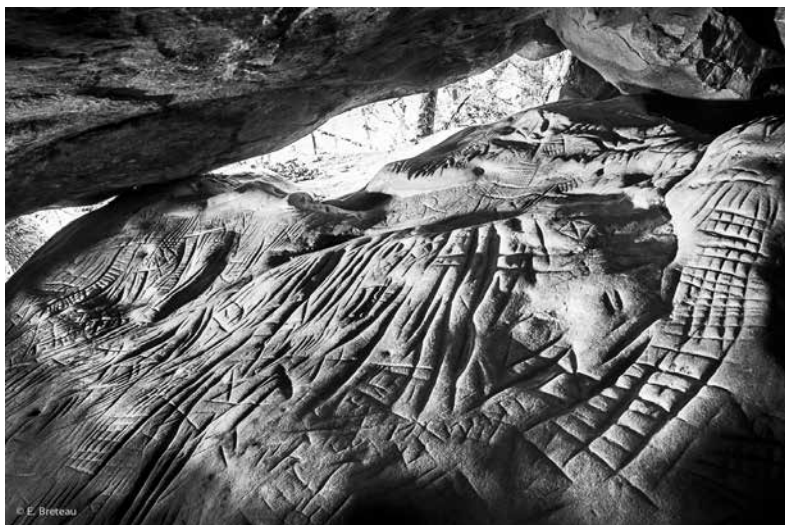
4. Boissy-aux-Cailles (Seine-et-Marne) « La Vallée du Jeton », abri sous roche Sillons très profonds et quadrillages.